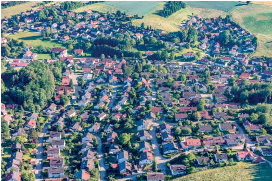
Luftaufnahme der Einberg-Siedlung

der Untersuchung eines Teils des Einbergs beauftragt, ob eine Nachverdichtung durch Aufstockung bzw. nachträglicher Ausbau eines Dachgeschosses möglich sei.