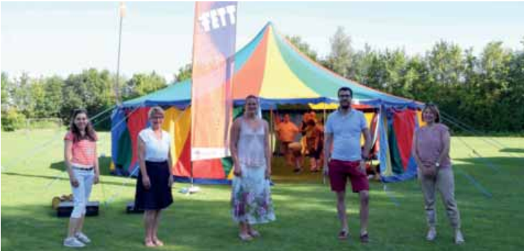
Gemeindevertreter und Organisierende machen sich ein Bild von der Veranstaltung.