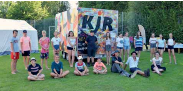
VOLLFETT war für Jugendliche und Eltern ein voller Erfolg.

Einhellige Meinung auch seitens der Jugendlichen und Eltern war: Eine coole Veranstaltung, die unbedingt wiederholt werden sollte! Das Fest endet mit dem gemeinsamen Abbau des VOLLFETT-Platzes.