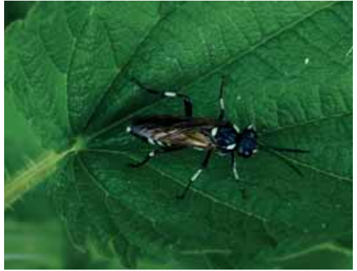
Gefleckte Blattwespe - Helmut Klein, Altdorf