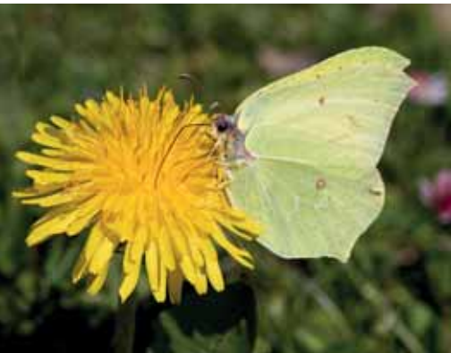
Feingliedriger Zitronenfalter auf Löwenzahn - Romano Gonnermann, Buch