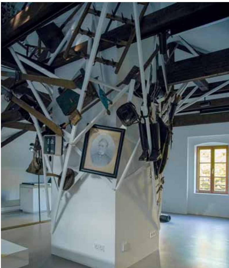
Der neue Geschichtsboden: Ansicht der außergewöhnlichen Gestaltung