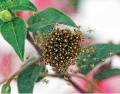
Gespinst von kleinen Gartenkreuzspinnen - Erika Schmid, Buch