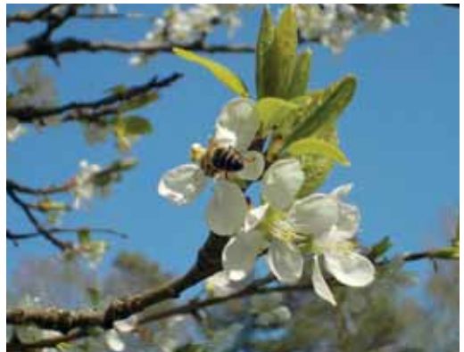
Kategorie Kinder: Kirschblüten mit Biene - Lea Ott, Buch