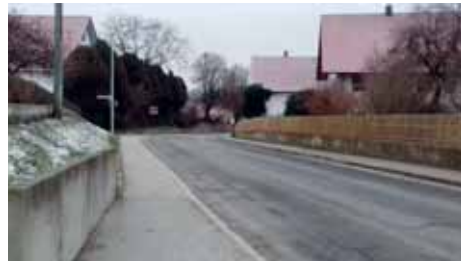
Ortseinfahrt in Thann aus Buch kommend

In der Gemeinderatssitzung am 17. Dezember 2018 wurden die Schäden an der Ortsdurchfahrt der Staatsstraße ST2330 besprochen. Anhand von einigen Bildern wurden die Stellen aufgezeigt, an denen Instandsetzungsarbeiten dringend notwendig sind. Hinsichtlich der Kosten erklärte Bürgermeister Göbl, dass diese zwischen der Gemeinde Buch am Erlbach und der Straßenbauverwaltung des Staatlichen Bauamts Landshut aufgeteilt werden. Der Gemeinderat stimmt dieser Vereinbarung zu.