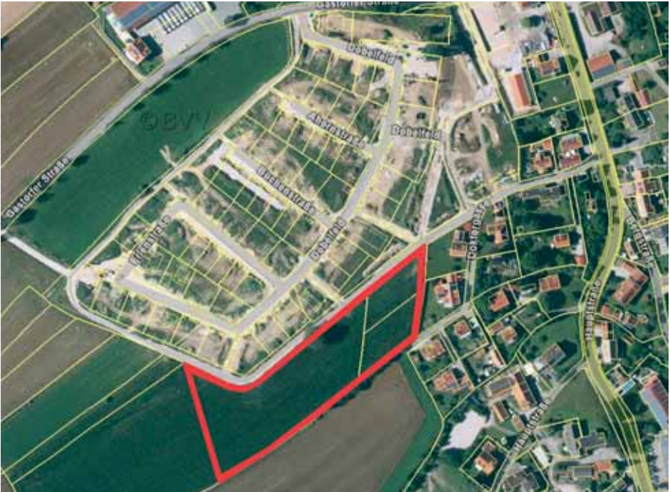
Auszug aus Bayern-Atlas (online): Das Baugebiet „Gastorfer Straße Erweiterung“ umfasst die Flurnummern 1002 Teilflächen, 1007/8 und 1007 Gemarkung Buch am Erlbach.

Diese beiden Beschlüsse wurden in der Sitzung gefasst. Im Weiteren wurde