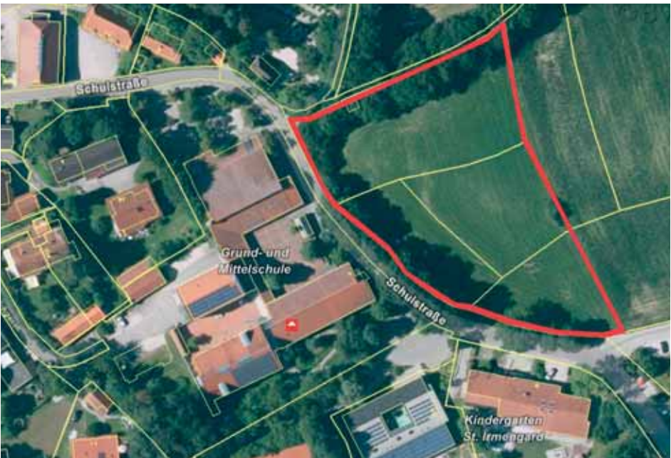
Karte entnommen aus Bayern-Atlas (online) Das Planungsgebiet für die 1,5-fach-Turnhalle umfasst die Flurnummern 843, 844, 845 u. 855 Teilflächen, Gemarkung Buch am Erlbach;

Architekt Johannes Sattlegger vom Architekturbüro Dömges, Regensburg