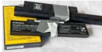
Mithilfe eines Klebebandes können ausgebaute Lithium-Ionen-Akkus leicht gesichert werden.

bereits vor der Fahrt zur Altstoff-Sammelstelle so weit wie möglich von den Geräten zu lösen. „Akkus, die außen angebracht wurden, sollten vorab demontiert und die Kontakte mit einem Klebeband gegen Kurzschluss gesichert oder einzeln in Plastiktüten verpackt werden. Die Platzwarte nehmen den Akku zur weiteren Entsorgung gerne persönlich entgegen“, erklärt der zuständige Sachgebietsleiter Gernot Geißler.