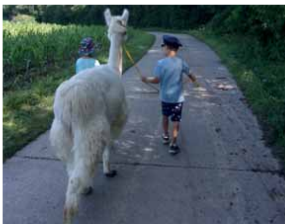
Bericht und Fotos: Kindergarten St. Irmengard