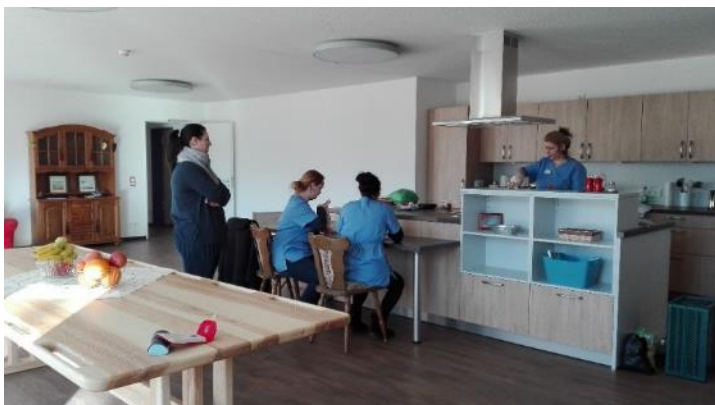
Die Küche der WG in Oberhaching.

Wer sich noch informieren oder für einen Platz vormerken möchte, wendet sich bitte an: