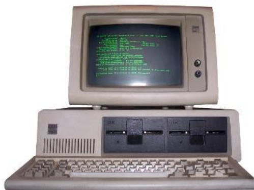
IBM-PC 1981

Bei Fragen, oder wenn Sie sich vom Newsletter abmelden wollen (was wir sehr bedauern würden) senden Sie bitte eine Mail an presse@maro-genossenschaft.de